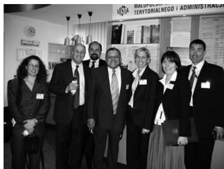
Eksperci z USA, Konsul i pracownicy Konsulatu