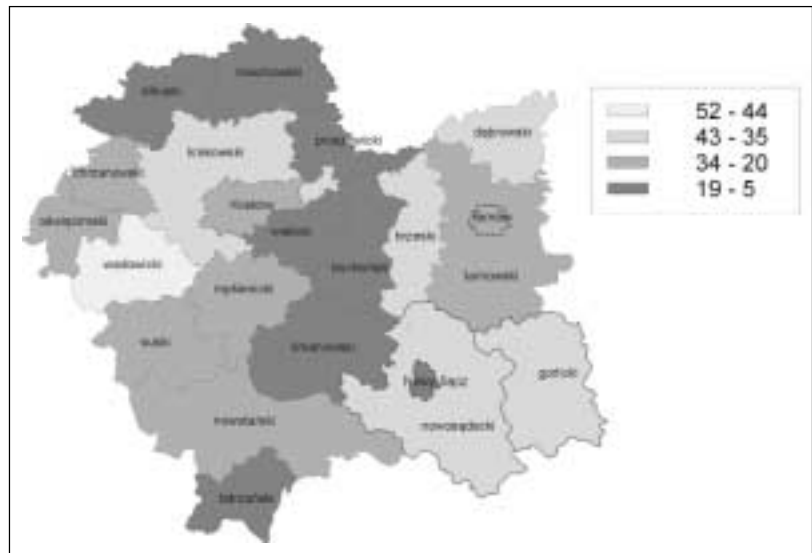
Wykres 3. System pomocy osobom uzależnionym – zasoby instytucjonalne (lecznictwo odwykowe, grupy samopomocowe, telefony zaufania i punkty konsultacyjne dla uzależnionych i ofiar przemocy)