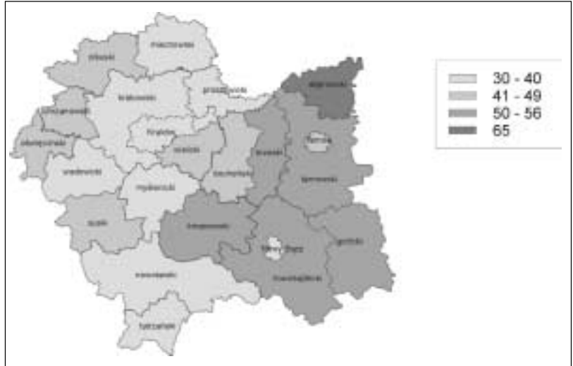
Poziom problemów społecznych w powiatach województwa małopolskiego w 2001 roku