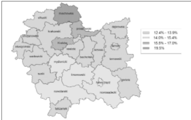
Ilość ludności w wieku poprodukcyjnym w odsetkach ogółu ludności