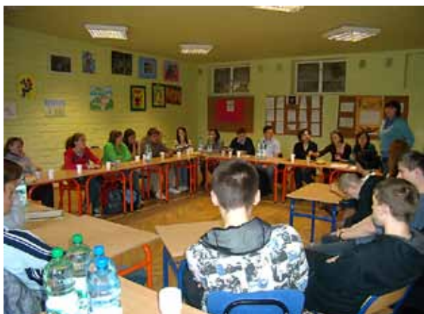
Szkolenie mediatorów w placówce na os. Szkolnym