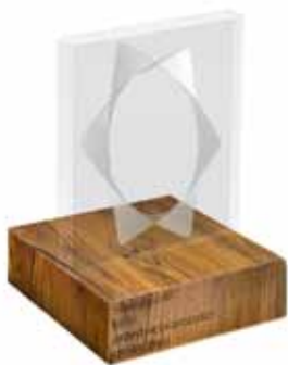
Statuetka „Małopolski Lider Przedsiębiorczości Społecznej”

Małopolska jest wiodącym regionem w rozwoju przedsiębiorczości społecznej. Świadczy o tym coraz większa liczba firm społecznych, które sprawnie funkcjonują na rynku. Coraz większa liczba podmiotów ekonomii społecznej oraz wewnętrzna konkurencja w tym sektorze wskazują, że nadszedł czas, aby wybrać najlepsze przedsiębiorstwo społeczne w Małopolsce. Dlatego w tym roku Regionalny Ośrodek Polityki Społecznej w Krakowie rozpoczyna nową inicjatywę jaką jest konkurs Małopolski Lider Przedsiębiorczości Społecznej 2011 . Jego celem jest promocja ekonomii społecznej i małopolskich przedsiębiorstw społecznych. Chcemy wyróżnić i promo-