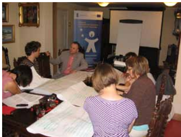
Szkolenie pn. „Aktywizacja środowiska lokalnego w ramach Programu Aktywności Lokalnej”