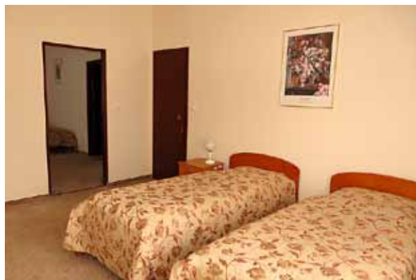
Pokoje dla gości

Jeżeli poszukują Państwo dla swoich Gości szczególnego, dyskretnego miejsca w Krakowie na czas pracy, szkolenia, zabawy, wypoczynku, nauki, rehabilitacji, miłego spędzania czasu w bardzo dobrej atmosferze – polecamy nasz Ośrodek i serdecznie zapraszamy do zapoznania się z naszą ofertą na stronach www.