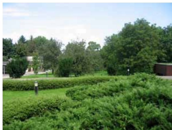
Dostępny dla gości ogród

Firma Społeczna Laboratorium Cogito Sp. z o.o.