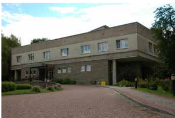
Ośrodek recepcyjno-szkoleniowy „Zielony Dół”

Uruchomiliśmy w obiekcie profesjonalną kuchnię, w której pod opieką najlepszych Szefów kuchni przyrządzane są wspaniałe posiłki dla naszych Gości. Jesteśmy gotowi przygotować dla Państwa różnego rodzaju imprezy, od ekskluzywnych bankietów, po imprezy plenerowe w ogrodach Ośrodka możliwe dla 300 Gości. Świadczymy usługi w Ośrodku oraz usługi cateringowe w miejscu wskazanym przez Klienta.